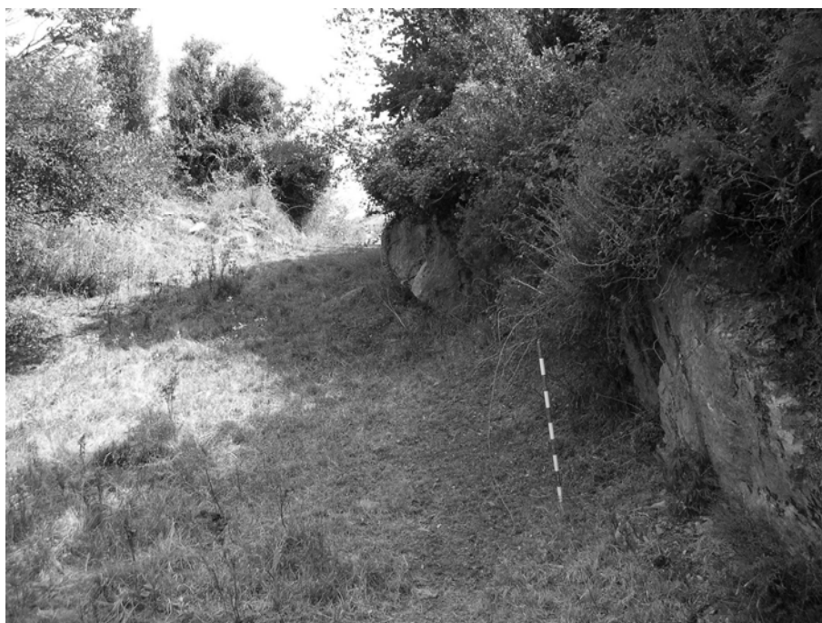
Figura 2. Vista del foso del castro de Alava (Salas, Asturias).

propio código), podemos entresacar datos interesantes, introduciendo estas narraciones en algunos planos de la investigación arqueológica. Así, podríamos emplear estos relatos en la lista de elementos sintomáticos a los que atender en las tareas de prospección, o utilizarlos en el proceso de interpretación arqueológica, como un referente más, elaborado por una opción de conocimiento diferente a la arqueológico-académica que nosotros manejamos. A la vez, la contrastación de los discursos contruidos desde la tradición oral campesina con los arqueológicos, nos puede facilitar el acceso a visiones connotadas de otredad de paisajes, enclaves, evidencias materiales... lo que nos ayudará a sustraernos de los componentes presentistas y etnocéntricos de los que nos es tan difícil desprendernos en nuestras investigaciones académicas.