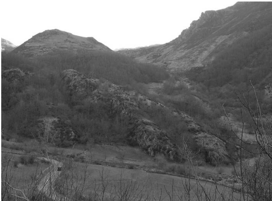
Figura 5. Vista general del castro de El Castiel.lu de L.lamardal (Somiéu), a 1200 metros de altitud.

tala y roza en terrenos similares a los de pastos-, las actividades recolectoras, las artesanías y las actividades de mantenimiento y reproducción de la propia comunidad. Respecto a la agricultura, una tarea pendiente para nuestro ámbito de estudio es la localización y estudio de las áreas de cultivo, algo que por ejemplo en Galicia ya empieza a ofrecer interesantes datos (Parcero, 1998), y que en nuestra área apenas puede atisbarse para algunos pocos ejemplos, como El Castru de Vigaña, en Miranda (Fernández Mier, 1999: 260-161). El estudio de las actividades artesanas, tales como la cestería, la alfarería, la metalurgia, confección textil... deben comenzar a recibir nuestra atención, más allá de un interés puramente tipológico, y en su estudio han de incorporarse referentes etnoarqueológicos que apoyen descripciones densas que den lugar a relatos interpretativos interesantes (Marín, 2007 y 2008). El último grupo de tareas productivas de la anterior enumeración, las actividades de mantenimiento y reproducción grupal (Sanahuja, 2007: 21-28) es, sin duda alguna, el más desatendido por la investigación actual (Hernando, 2005), y es algo que, necesariamente, debemos abordar con urgencia para dar presencia en nuestras interpretaciones a la mitad de la población protagonista de nuestros relatos.