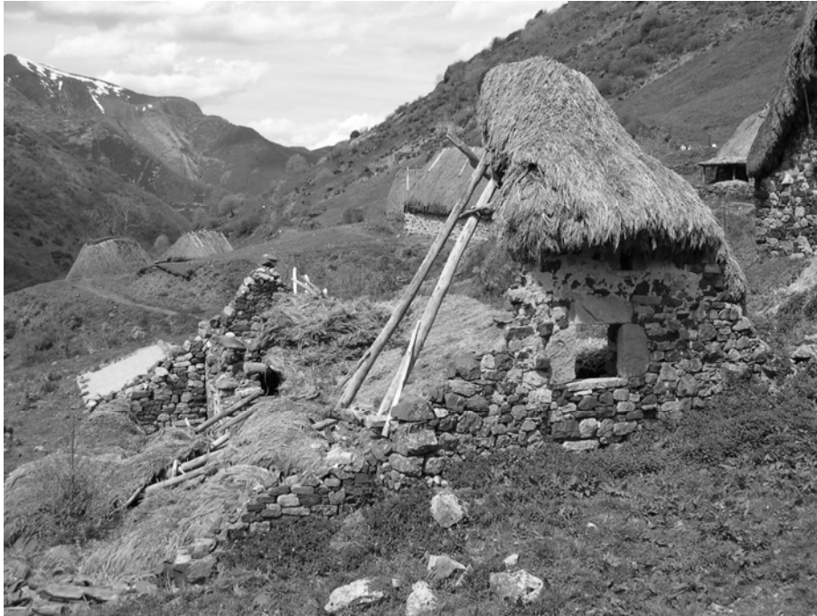
Figura 4. Ruinas de una construcción ganadera en la braña de La Pornacal (Somiéu). Han pasado un par de años desde que comenzó a arruinarse y en pocas décadas no quedarían evidencias notorias sobre el terreno para reconocer su existencia.

El polo opuesto del rango posible de sistemas de poblamiento lo encontraríamos en las zonas con especial presión por el control y el aprovechamiento de las zonas de pastos, propiciado por mayores densidades de población en el piedemonte y por las mejores cualidades de los propios pastizales. En este contexto se harían necesarios mecanismos para reclamar, por decirlo de alguna manera, el derecho al aprovechamiento de estos pastizales. En la Edad del Hierro, con el nuevo discurso de la materialidad establecido por los comunidades castreñas, ya no serían los monumentos megalíticos los hitos demarcadores y ordenadores del espacio, como ocurría en los períodos anteriores de la Prehistoria reciente cantábrica (De Blas, 1983), sino que serían los propios poblados (Fig. 5), monumentalizados, los que denotarían similares mensajes de parcelamiento, definición o codificación de las territorialidades de un paisaje, en clave identitaria, social, simbólica y productiva, que tomaría forma con las comunidades castreñas del I er milenio a.C. (Parcero, 2002; González Ruibal, 2006-07: 103-118).